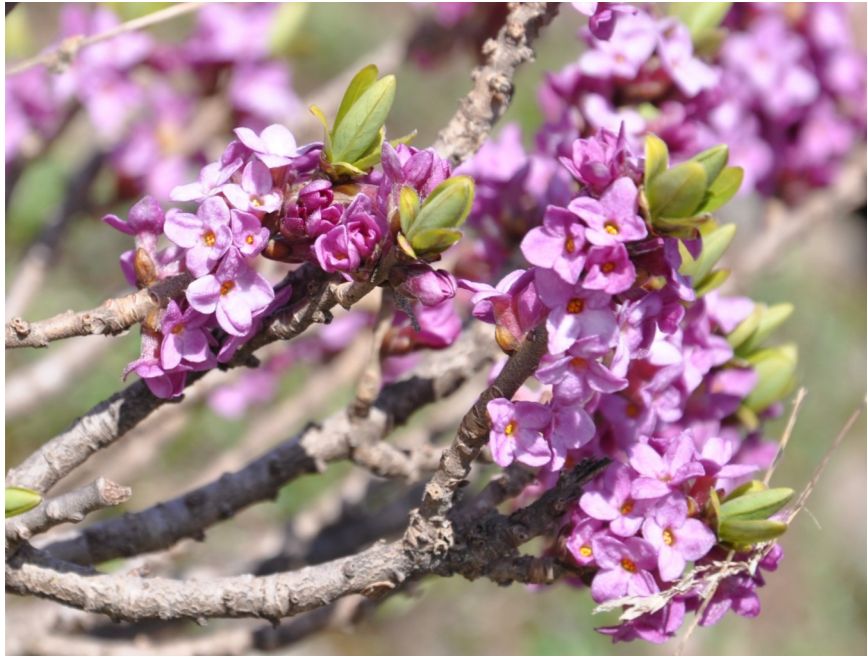
Echter Seidelbast ( Daphne mezereum ), Stützalp