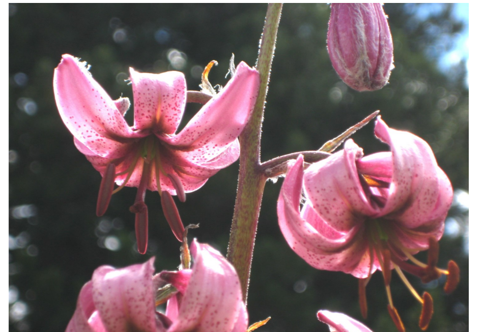
Türkenbund ( Lilium martagon ), Dorfberg