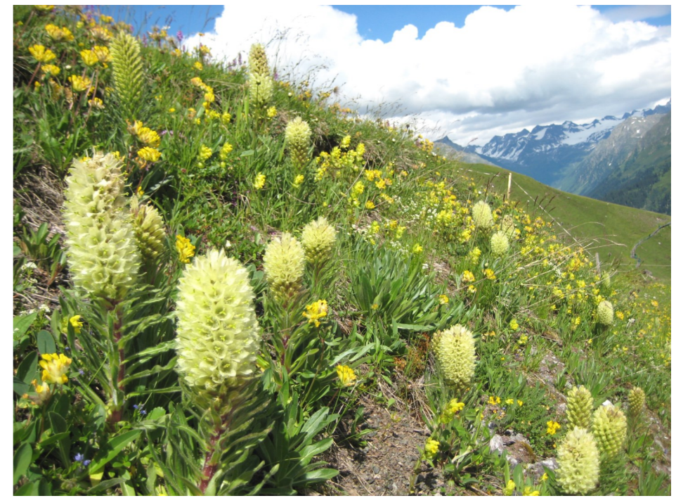
Straussblütige Glockenblume ( Campanula thyrsoides ) Parsennmeder