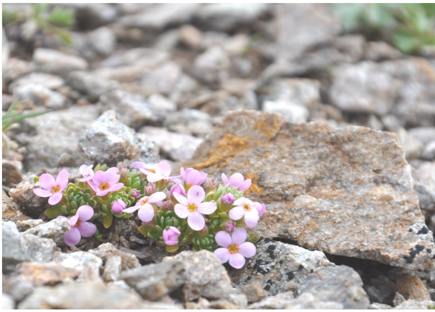
Alpen-Mannsschild ( Androsace alpina ), Tiejer Fürggli. Alle Mannsschildarten sind geschützt.