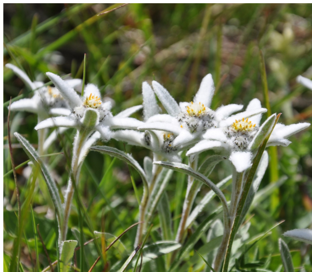
Edelweiss ( Leontopodium alpinum ), Panoramaweg