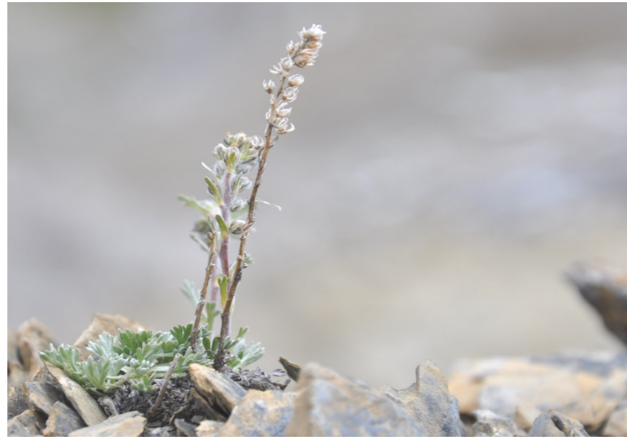
Ährige Edelraute ( Artemisia genipi ), Chörbs Horn. Alle kleinen Edelraute-Arten sind geschützt.