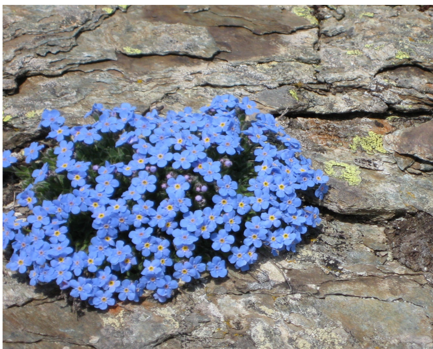
Himmelsherold ( Eritrichium nanum ), Sattelhorn