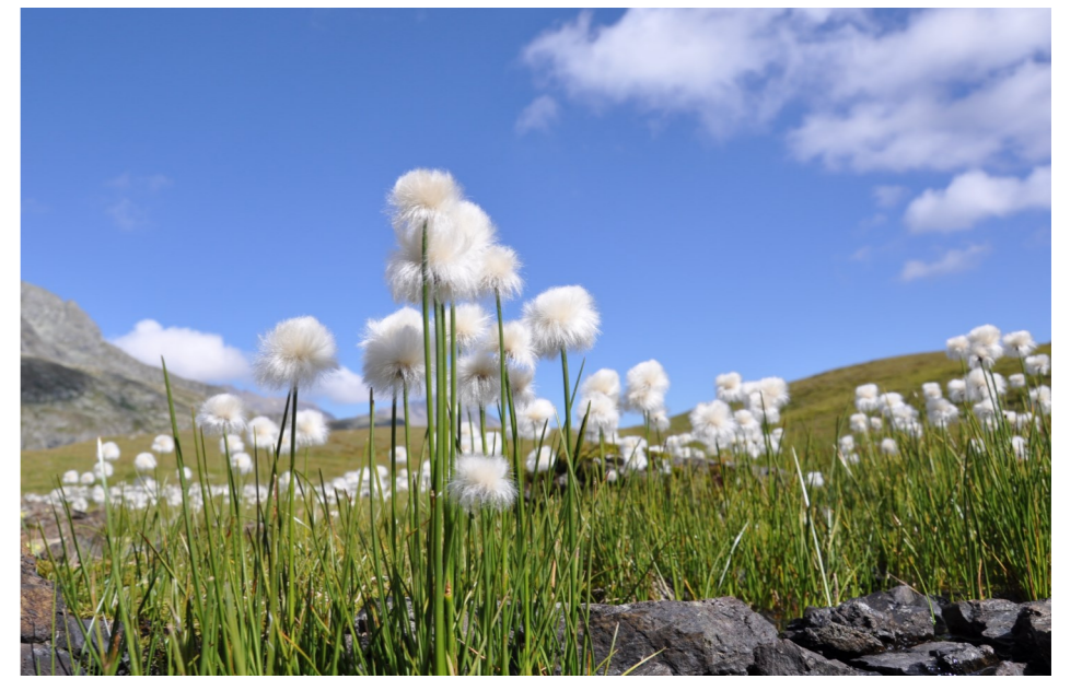
Scheuchzers Wollgras ( Eriophorum scheuchzeri ), Flüelapass. Alle Wollgräser sind geschützt.