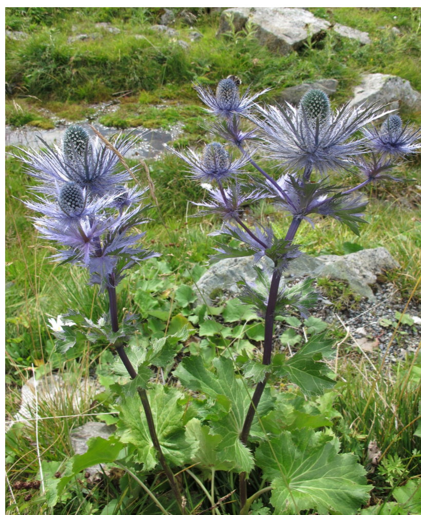
Alpen-Mannstreu ( Eryngium alpinum ) Flüelapasstrasse