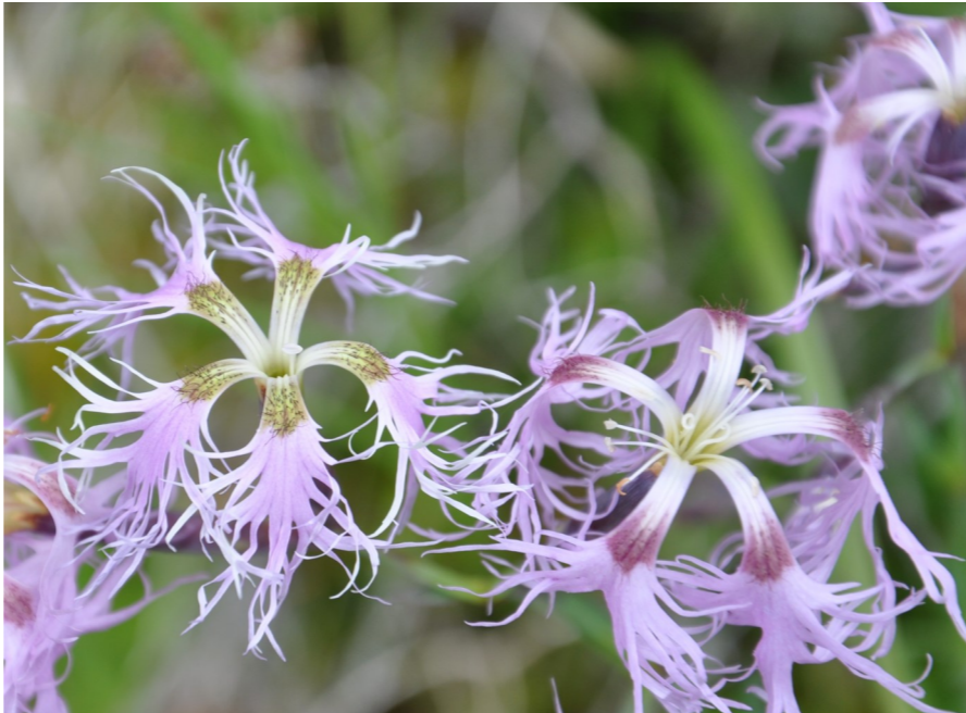
Prachtnelke ( Dianthus superbus ), Tschuggen