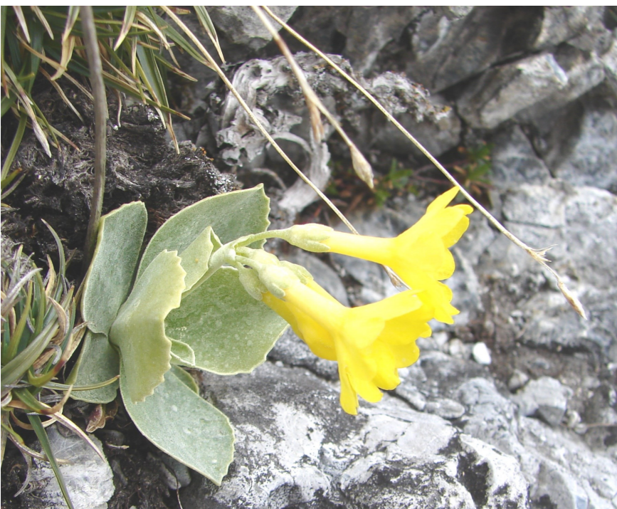
Aurikel ( Primula auricula ), Schatzalp